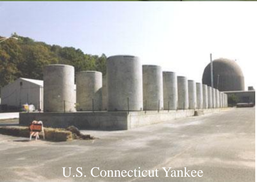
U.S. Connecticut Yankee